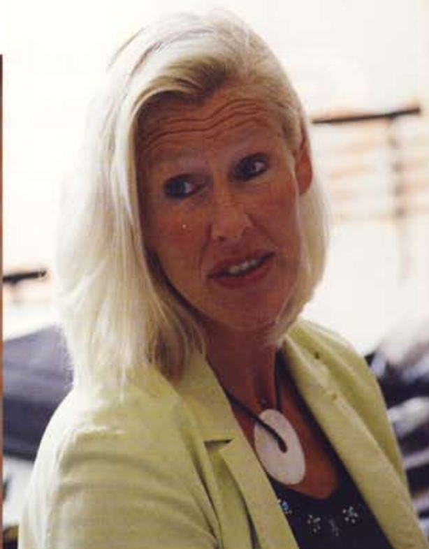
... Men det er ikke kun sjov påpeger kollega Gitte Schwaner – der ligger masser af læring bag konceptet. Elevernes kendskaber er i fokus.